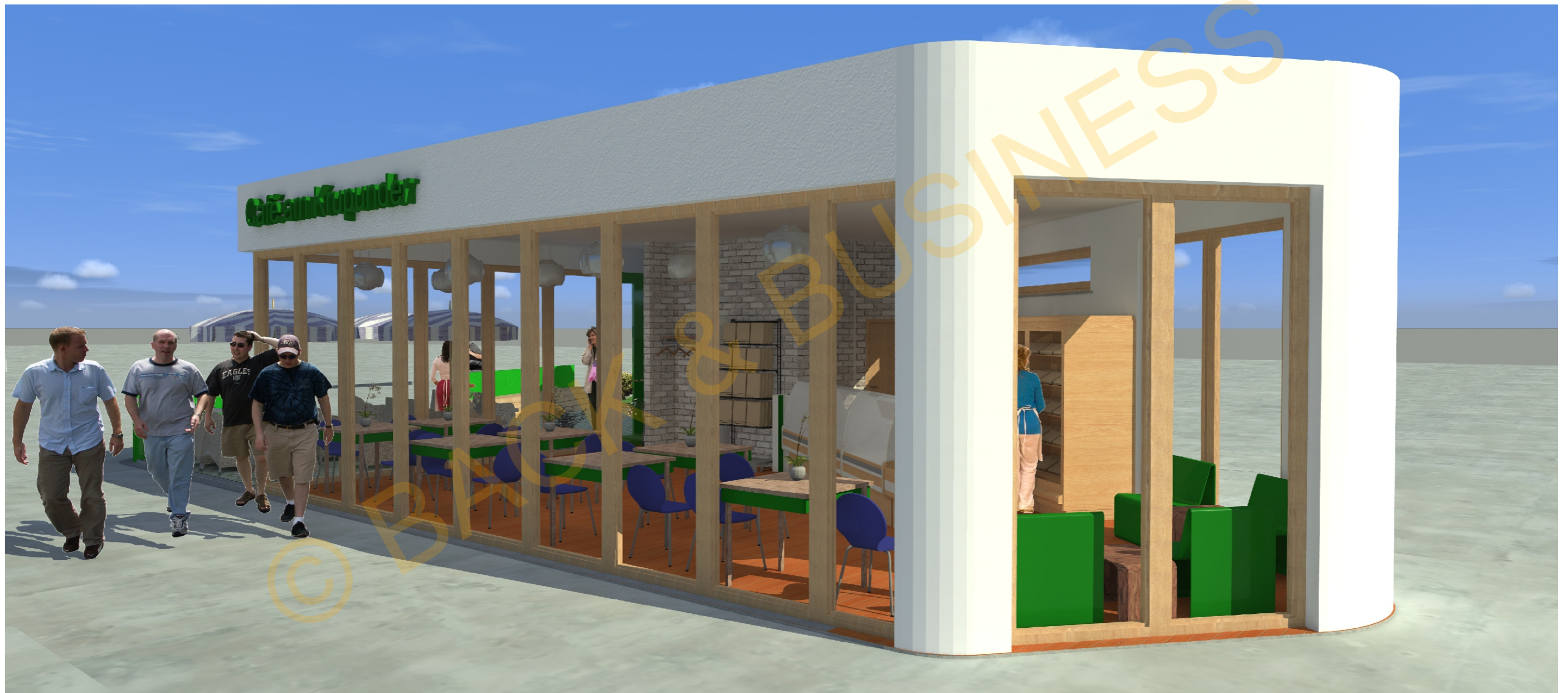
Café am Krupunder /Sparkasse Geldautomaten Perspektive Nord-Ost