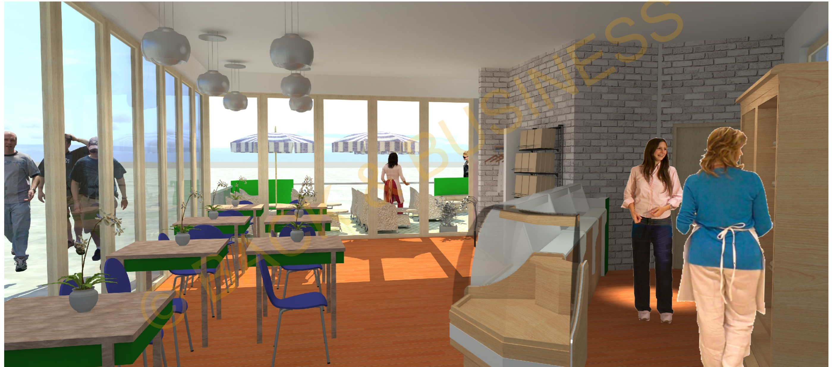
Café am Krupunder mit Terrasse /Sparkasse Geldautomaten Perspektive Ost