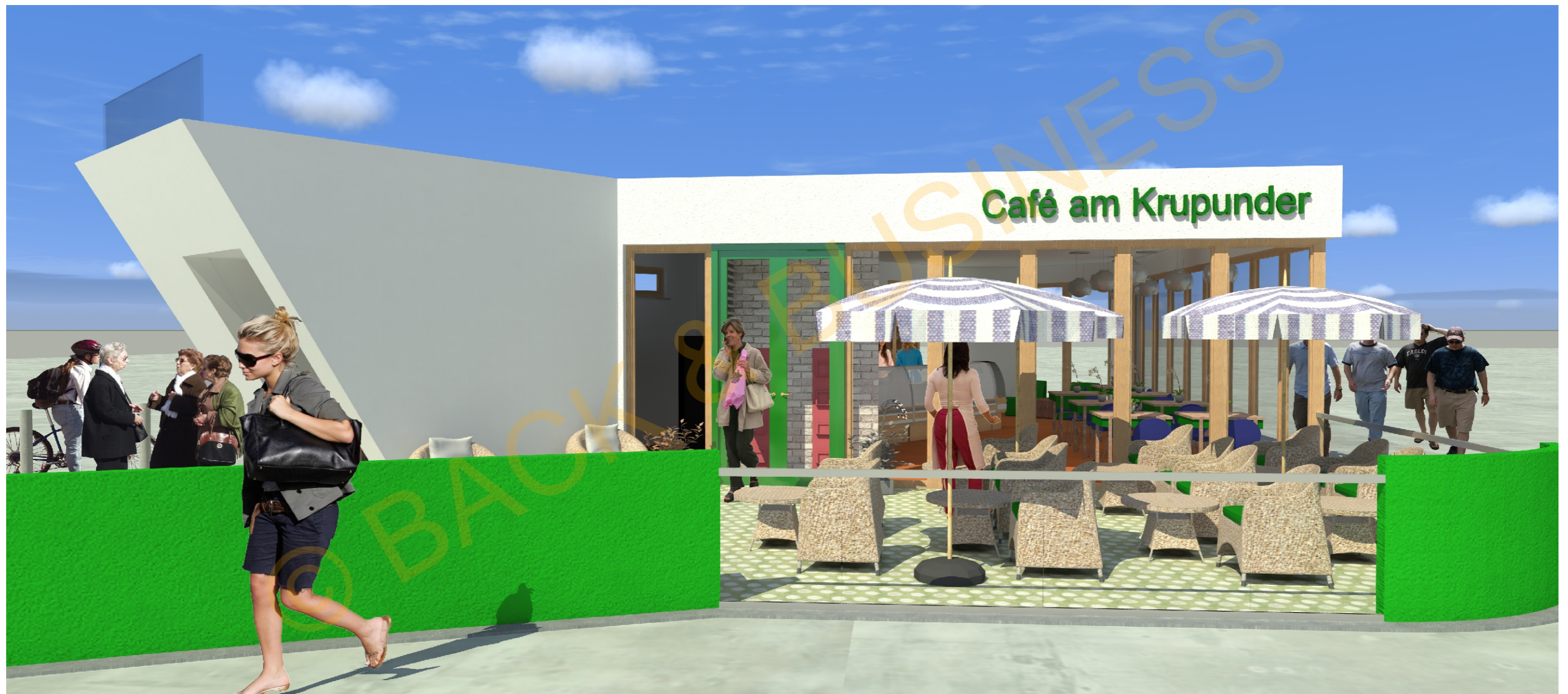
Café am Krupunder /Sparkasse Geldautomaten Perspektive Nord -Ost