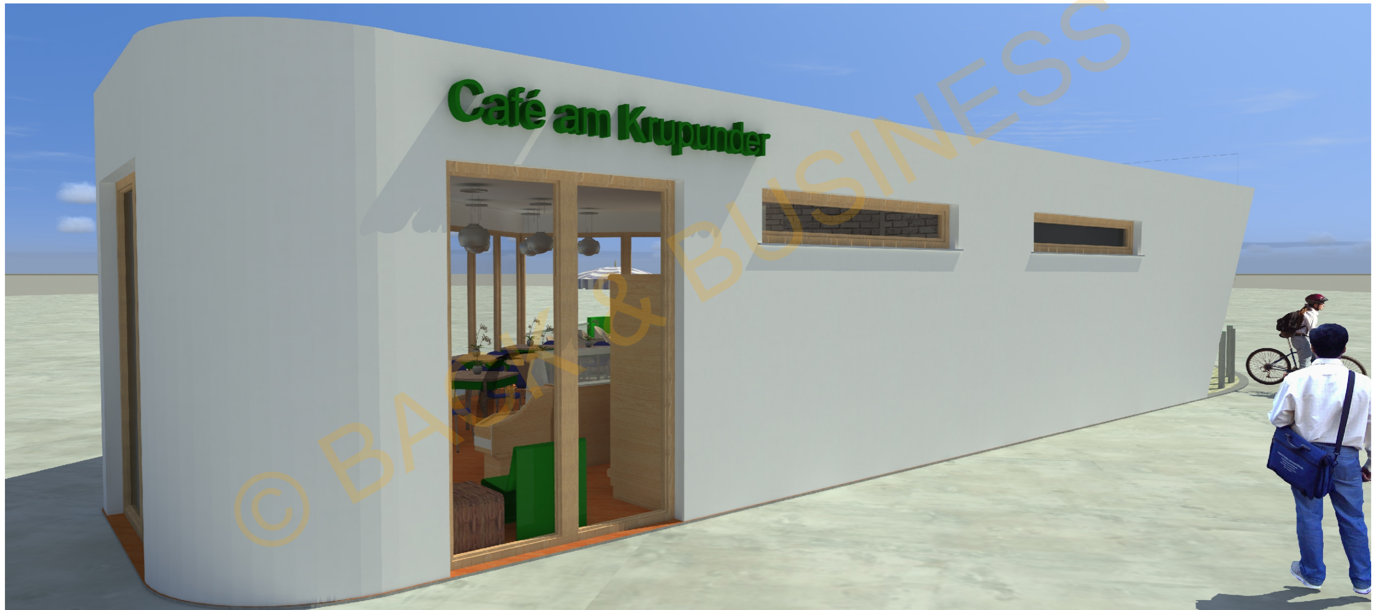
Café am Krupunder /Sparkasse Geldautomaten Perspektive Süd