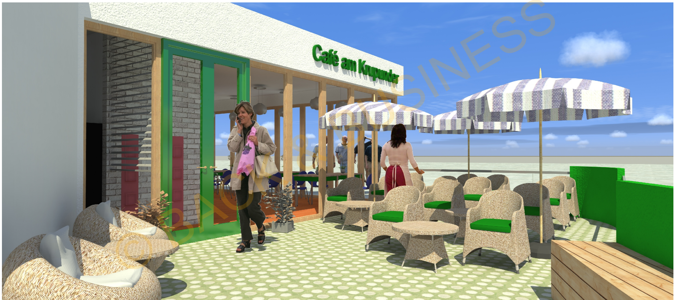
Café am Krupunder /Sparkasse Geldautomaten Perspektive Nord -Ost